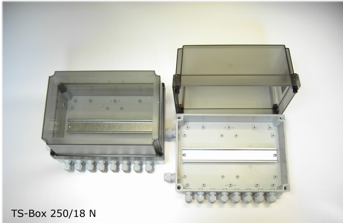
TS-Box 250/18 N

TS-Box 250/18 N für PAB, MPA 21, 2 MPA 41, 1 MPA 81 Spezialgehäuse IP66 (verschraubt) Material: Polycarbonat/ Polyamid Brandklassifikation: UL746C5 Temperaturbereich: -40°C — +80°C