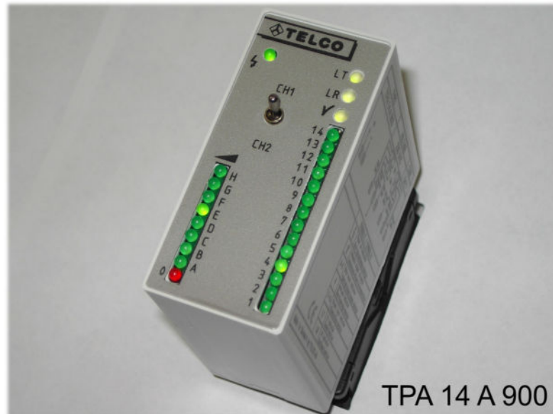
TPA 14 A 900

Prüf- und Justierverstärker für ein und zwei Lichtstrecken