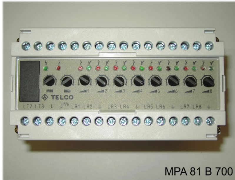
MPA 81 B 700

Achtfach Multiplexverstärker für LT/LR Reichweite mit LT/LR 100 = 8m , 110 = 18m , 120 = 35m