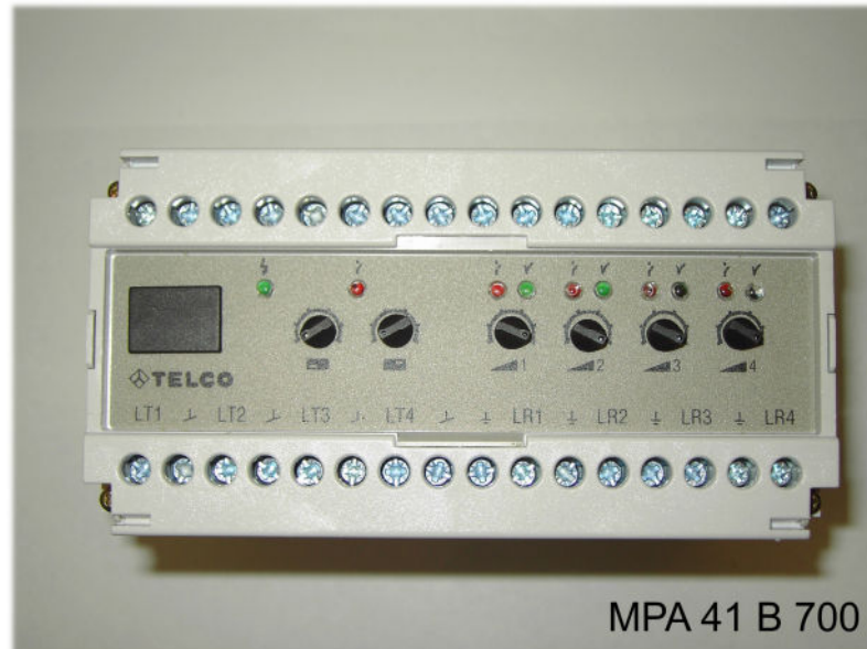
MPA 41 B 700

Vierfach Multiplexverstärker für LT/LR Reichweite mit LT/LR 100 = 8m , 110 = 18m , 120 = 35m