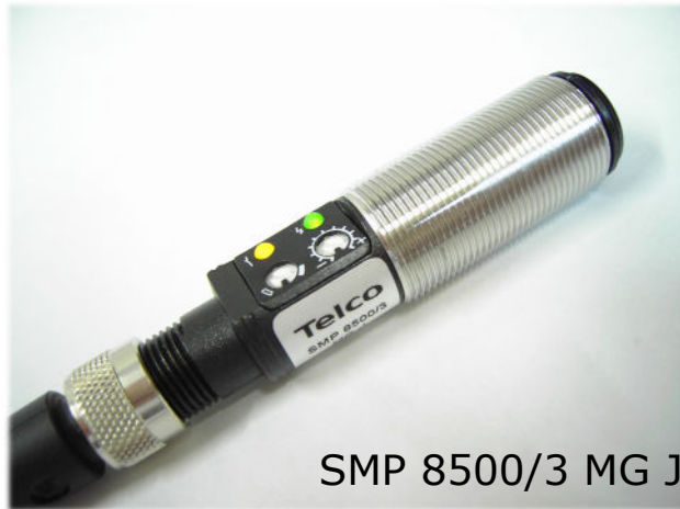
SMP 8500/3 MG J

Polycarbonatgewindegehäuse M18x1 ( PG ), Edeltstahlgewindegehäuse M18x1 ( MG ) Reichweite 0-50cm (SMP 8500), 70cm (SMP 8500/3) oder 100cm (SMP 8501) Funktions- und Schaltzustands LED — hohe Schmutzunempfindlichkeit