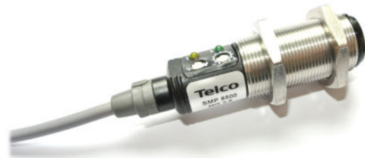
SMP 8500 MG 2,5