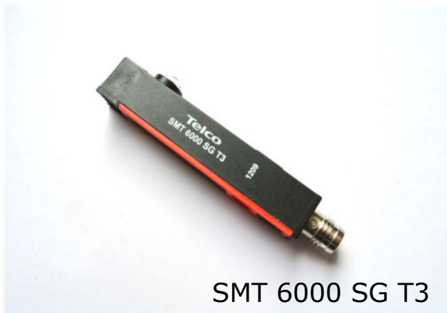
SMT 6000 SG T3

Reichweite bis 6m , integrierter Verstärker, Funktions LED (nur Stecker)