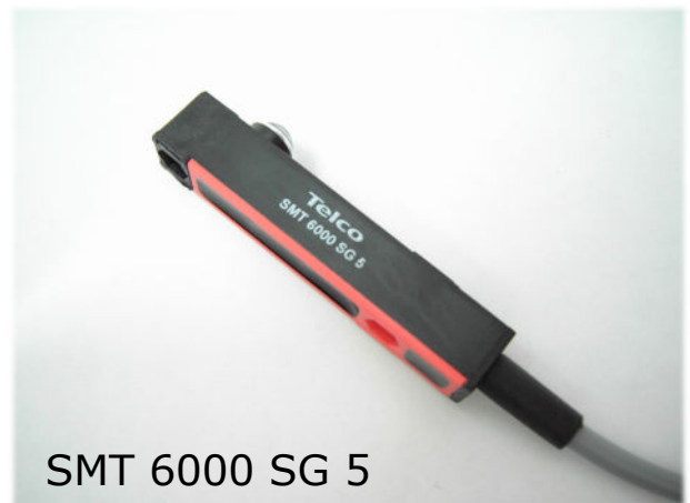
SMT 6000 SG 5