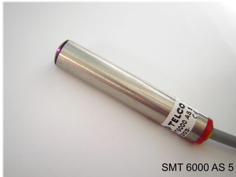
SMT 6000 AS 5

Polycarbonatgehäuse \varnothing 10mm glatt ( AP ), Edelstahlgehäuse \varnothing 10mm glatt ( AS ) Reichweite bis 6m , integrierter Verstärker, Funktions LED