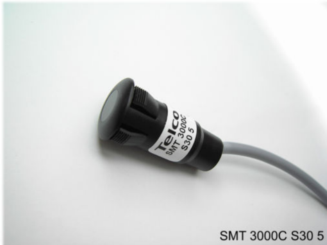
SMT 3000C S30 5

Polycarbonatgehäuse mit Schnappbefestigung, integrierter Verstärker Reichweite bis 6m (SMT 3000C), 12m (SMT 3012C) oder 15m (SMT 3000HC)