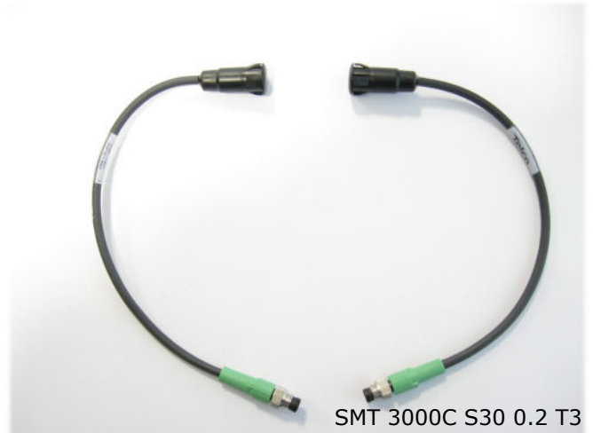
SMT 3000C S30 0.2 T3