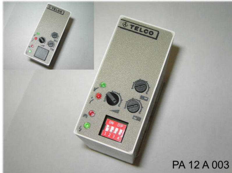
PA 12 A 003

Reichweite mit LT/LR 100 = 18m , 110 = 40m , 120 = 70m , Leistungsstufe G