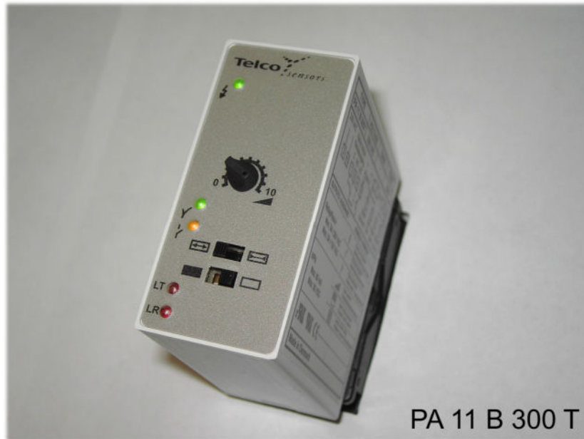
PA 11 B 300 T

Reichweite mit LT/LR 100 = 18m , 110 = 40m , 120 = 70m , Leistungsstufe G