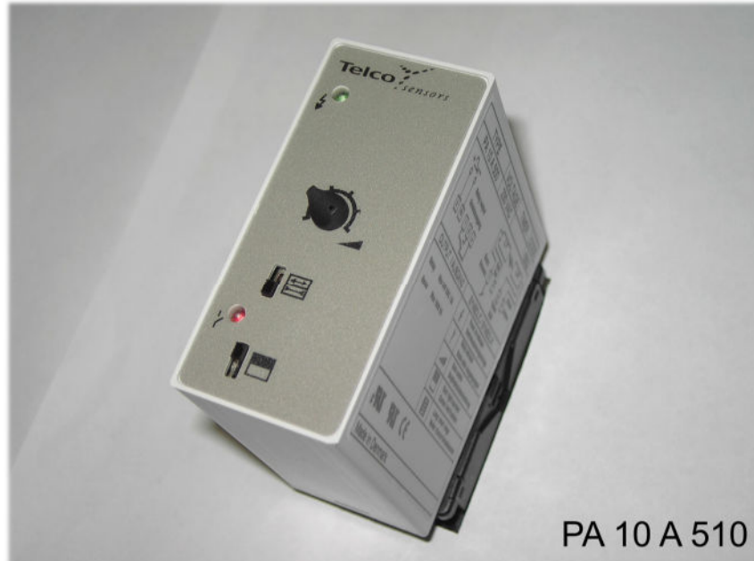
PA 10 A 510

Lichtschrankenverstärker nur für LT/LR 101 Reichweite bis 11m , Leistungsstufe K