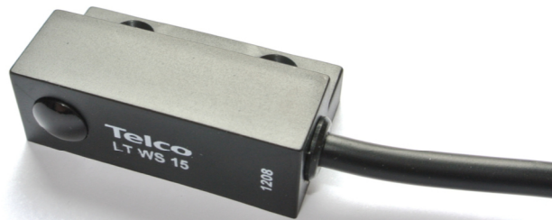
LT WS 15

Polycarbonatgehäuse 35x12x20mm, Reichweite bis 18 m schmutzunempfindlich, Durchdringungsfaktor N