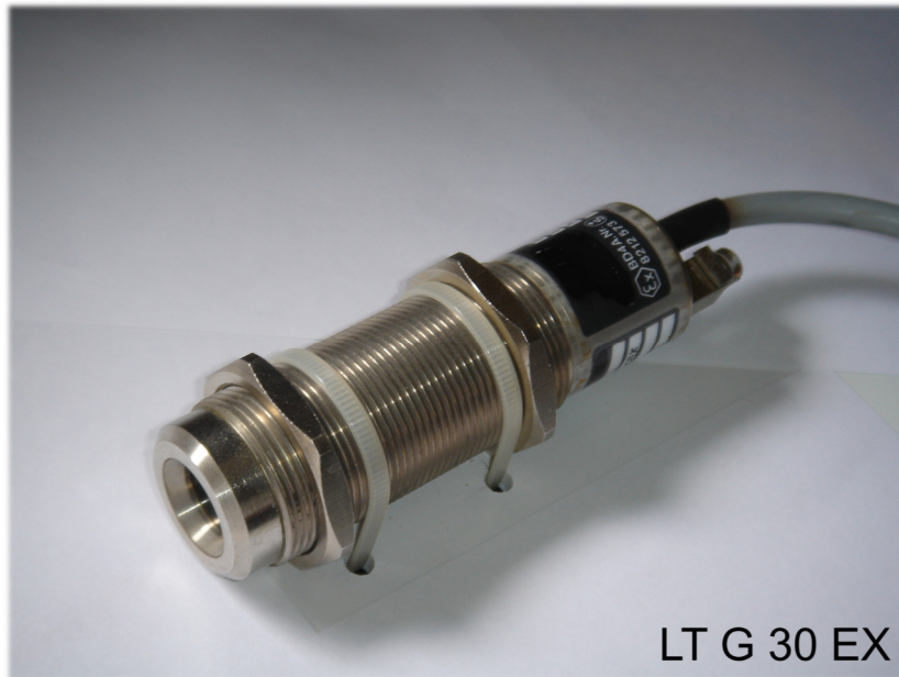
LT G 30 EX

Metallgewindegehäuse M30x1,5 Reichweite bis 30m , schmutzunempfindlich