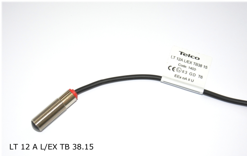
LT 12 A L/EX TB 38.15

EX II 3 G D T6 - Gruppe 2, Kategorie 3, Zone 2 (Gas) und 22 (Staub) Reichweiten bis 30m , schmutzunempfindlich, Schaltzustand LED , Durchdringungsfaktor H