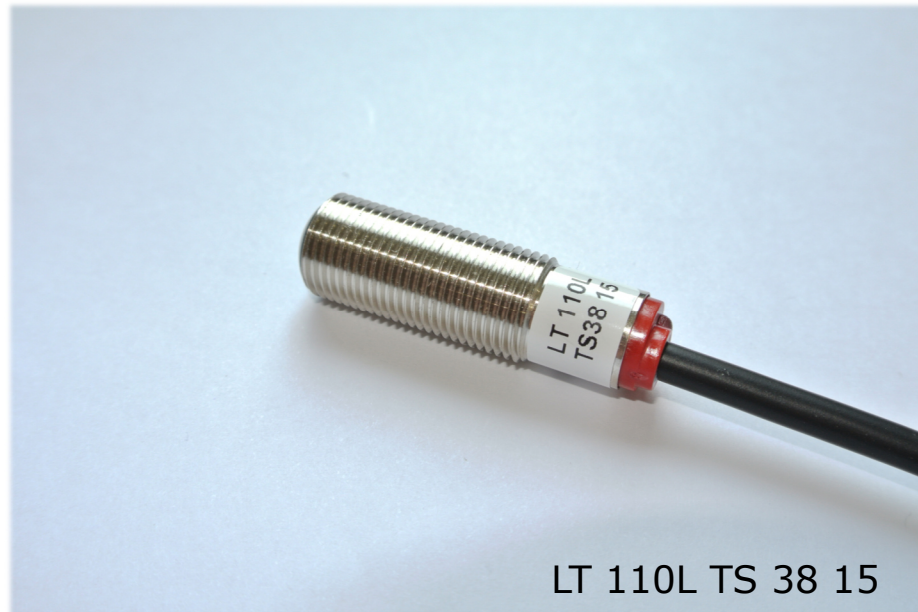
LT 110L TS 38 15

Edelstahlgewindegehäuse M12x1, Reichweite bis 40 m schmutzunempfindlich, Schaltzustands LED , Durchdringungsfaktor G