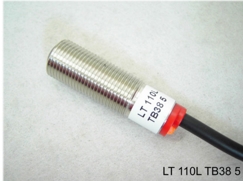
LT 110L TB38 5

Metallgewindegehäuse M12x1, Reichweite bis 40 m schmutzunempfindlich, Schaltzustands LED , Durchdringungsfaktor G