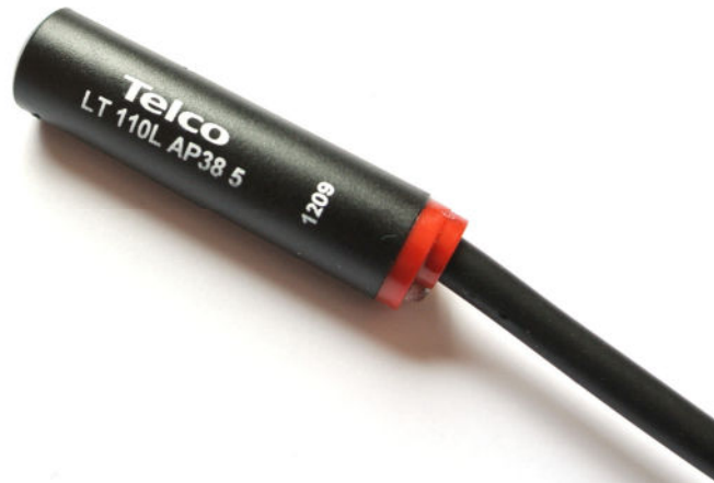
LT 110L AP 38 5

Polycarbonatgehäuse \varnothing 10mm glatt, Reichweite bis 40 m schmutzunempfindlich, Schaltzustands LED , Durchdringungsfaktor G