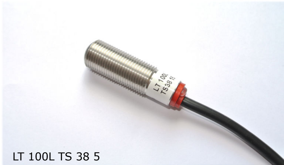
LT 100L TS 38 5

Edelstahlgewindegehäuse M12x1, Reichweite bis 18 m schmutzunempfindlich, Schaltzustands LED , Durchdringungsfaktor N