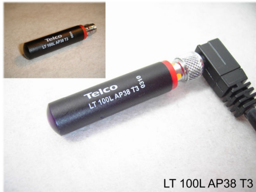
LT 100L AP38 T3

Polycarbonatgehäuse \varnothing 10mm glatt, Reichweite bis 18 m schmutzunempfindlich, Schaltzustands LED , Durchdringungsfaktor N