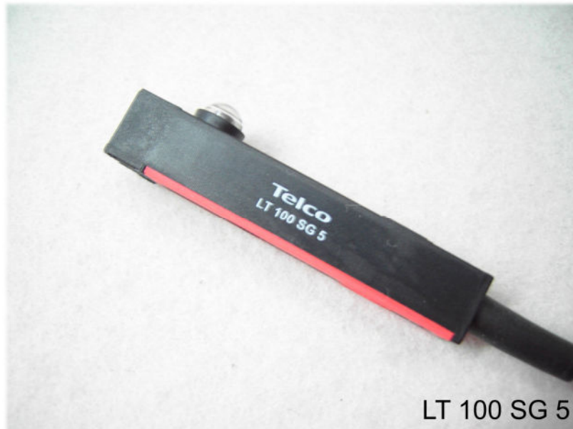
LT 100 SG 5

Polycarbonatgehäuse 60x9,5x11,5mm, Reichweite bis 18 m schmutzunempfindlich, Durchdringungsfaktor N