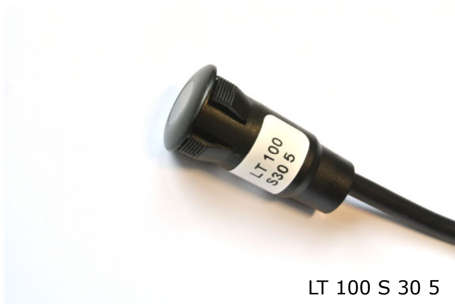
LT 100 S 30 5

Polycarbonatgehäuse mit Schnappbefestigung, Reichweite bis 18 m schmutzunempfindlich, Durchdringungsfaktor N