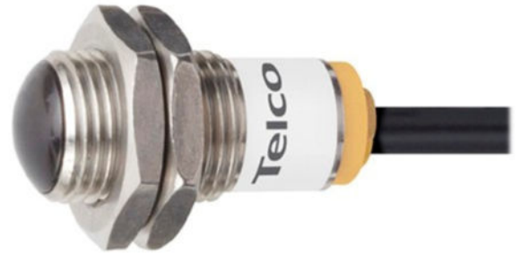
LR 101L TS 25 5