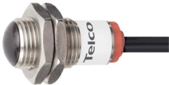
LT 101L TS 25 5

Edelstahlgewindegehäuse M12x1, Reichweite bis 11 m , Anzeige LED nur für PA 01, PA 10 A und DPA Verstärker geeignet