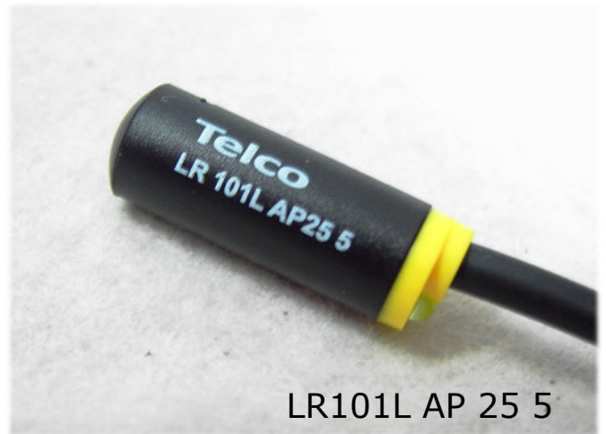
LR101L AP 25 5