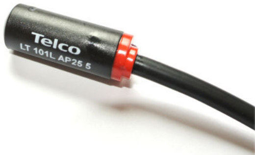
LT 101L AP 25 5

Polycarbonatgehäuse \varnothing 10mm glatt, Reichweite bis 11 m , Anzeige LED nur für PA 01, PA 10 A und DPA Verstärker geeignet