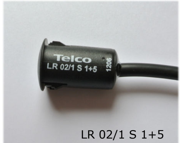
LR 02/1 S 1+5