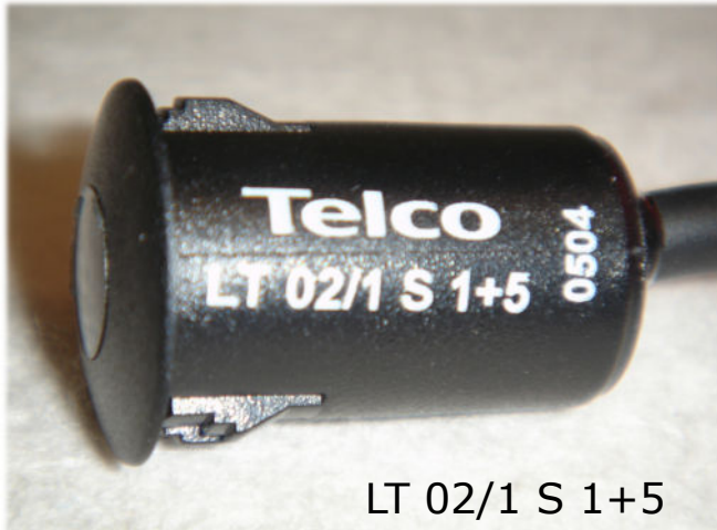
LT 02/1 S 1+5

Polycarbonatgehäuse mit Schnappbefestigung, Reichweite bis 5 m nur für PA 01, PA 10 A und DPA Verstärker geeignet