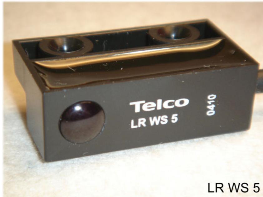
LR WS 5

Polycarbonatgehäuse 35x12x20, Reichweite bis 18 m , schmutzunempfindlich