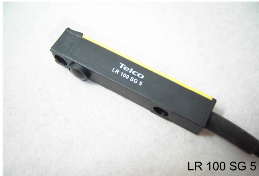
LR 100 SG 5

Polycarbonatgehäuse 60x9,5x11,5, Reichweite mit LR-100 bis 18 m , LR-100H bis 30 m schmutzunempfindlich