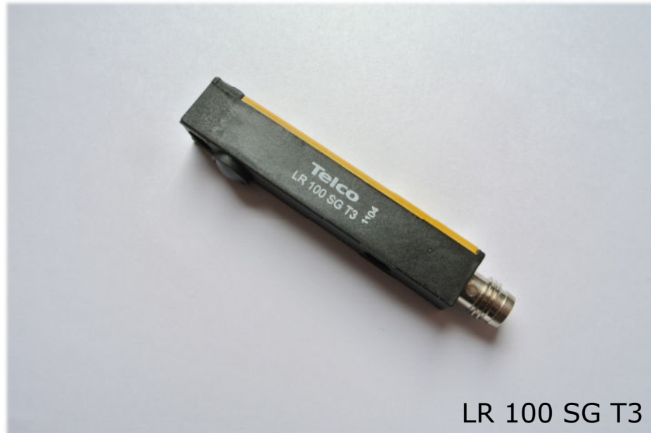
LR 100 SG T3

Polycarbonatgehäuse 60x9,5x11,5, Reichweite mit LT-100 bis 18 m , LT-100H bis 30 m schmutzunempfindlich