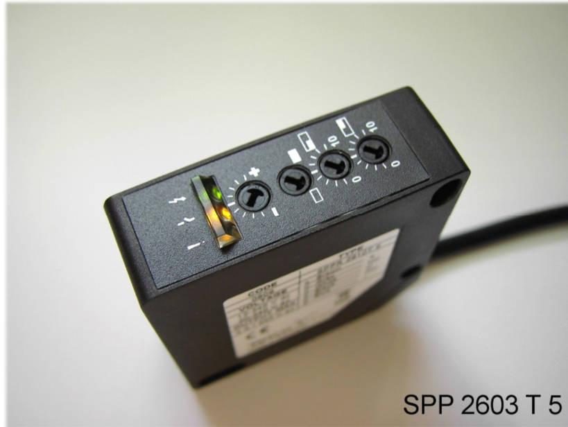
SPP 2603 T 5

Reichweite bis 3 oder bis 5m , Funktions-, Schaltzustands- und Signalzustand LED