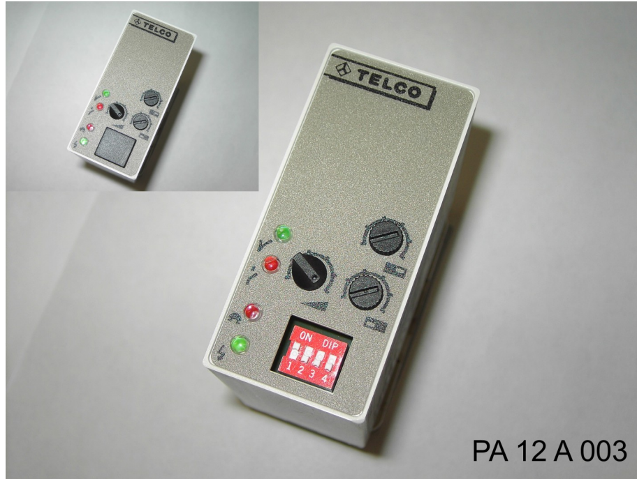
PA 12 A 003

Reichweite mit LT/LR 100 = 18m , 110 = 40m , 120 = 70m , Leistungsstufe G