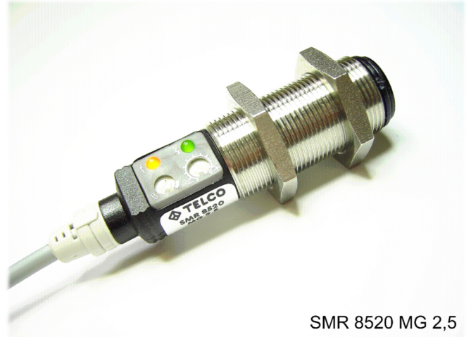
SMR 8520 MG 2,5