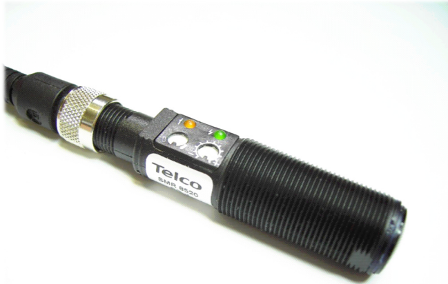
SMR 8520 PG J

Polycarbonatgewindegehäuse M18x1 ( PG ), Edeltstahlgewindegehäuse M18x1 ( MG ) Reichweite bis 20m , Allroundmodell für raue Umweltbedingungen, Funktions- und